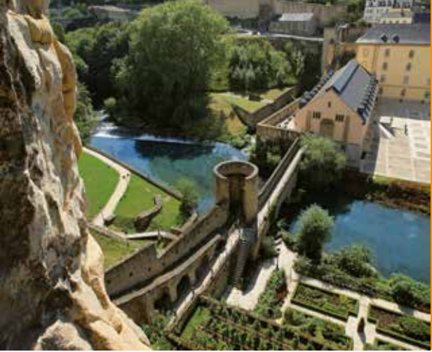
Las Casamatas del Bock: vista de las aspilleras