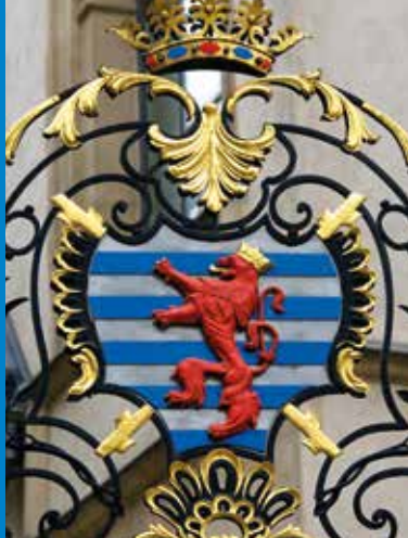
Armoiries de la Famille grand-ducale