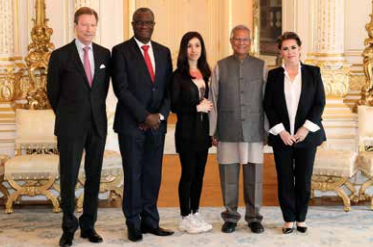
Forum international « Stand Speak Rise Up ! » @ Cour grand-ducale / Sophie Margue / tous droits réservés