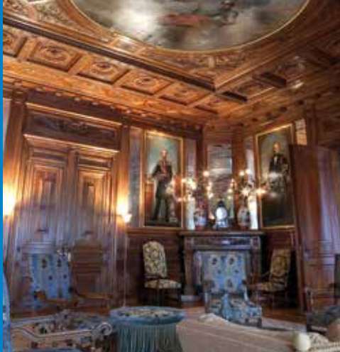
Salon des Rois