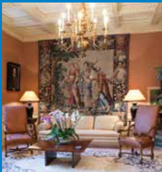
Salon de thé

1741 The stone balustrade of the balcony is replaced by a balustrade in wrought iron, which can be seen even nowadays.